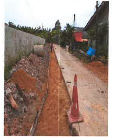
ตำบล ทบของเสม็ด, ตราด