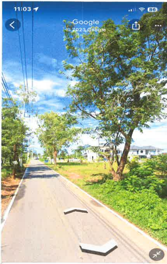
ตำบล หนองเสม็ด, ตราด 2 เดือนที่ผ่านมา · ดูรับอินน์ >