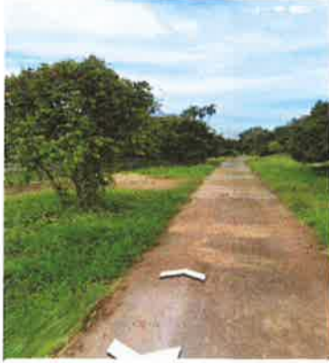
ตำบลหนองเสม็ด, ตราด 0 81 202 247 0 81 202 247